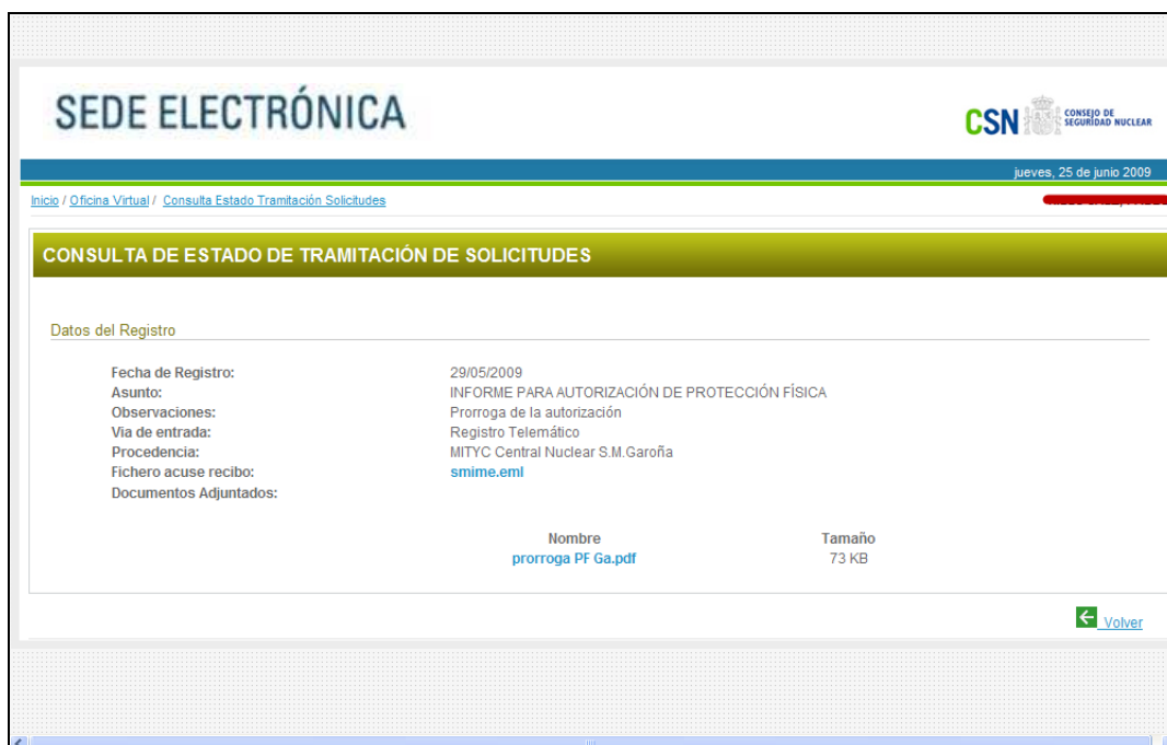
Figura 5 – Pantalla de detalle del registro de la solicitud

Pinchando en el título de cualquiera de las solicitudes, se podrá acceder a información de detalle del registro de la solicitud: