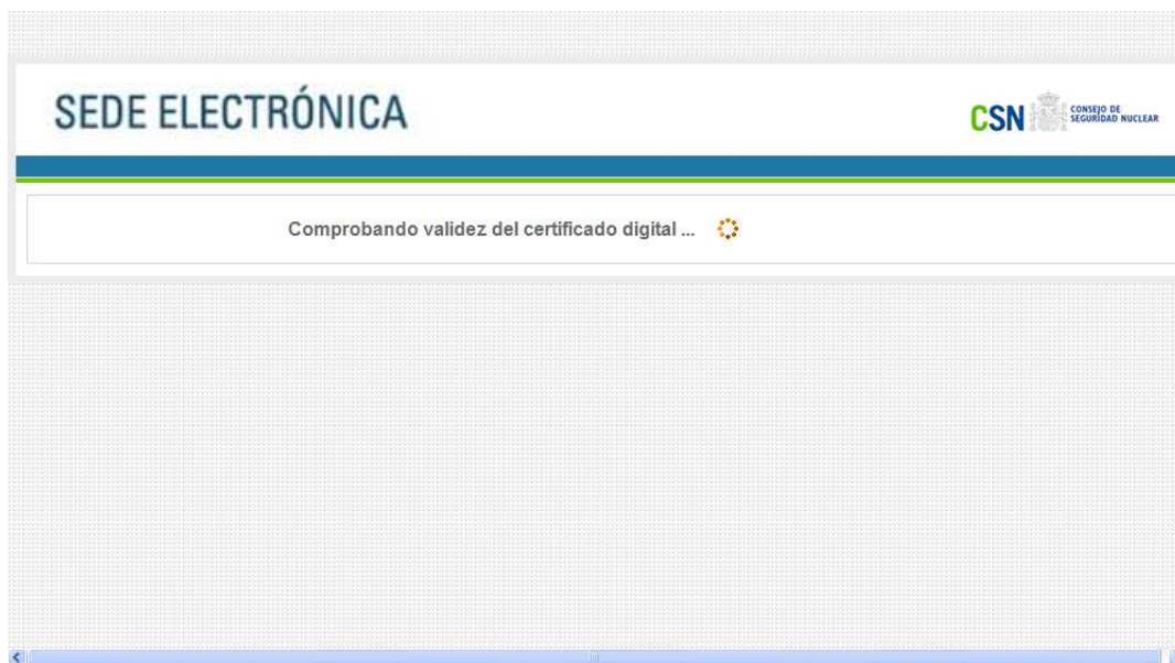
Figura 3– Pantalla de comprobación de validez de certificado digital

Tras introducir la clave y pulsar Aceptar, se realiza un proceso de validación del certificado digital. Durante dicho proceso, se mostrará la siguiente pantalla: