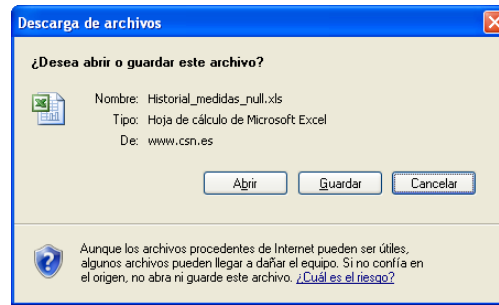
Figura 5 – Diálogo de descarga de documento Excel con historial de medidas

Una vez introducidas las condiciones de búsqueda, para realizar la búsqueda pulsar el literal Buscar (por defecto se realizará la búsqueda de todas las medidas registradas).