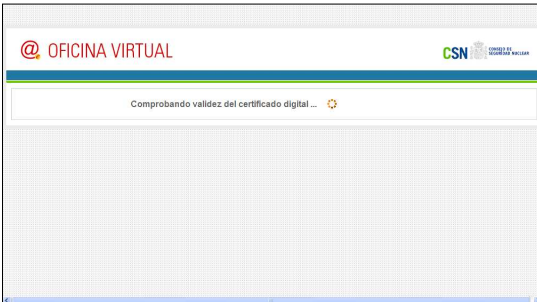
Figura 3– Pantalla de comprobación de validez de certificado digital

Tras introducir la clave y pulsar Aceptar, se realiza un proceso de validación del certificado digital. Durante dicho proceso, se mostrará la siguiente pantalla: